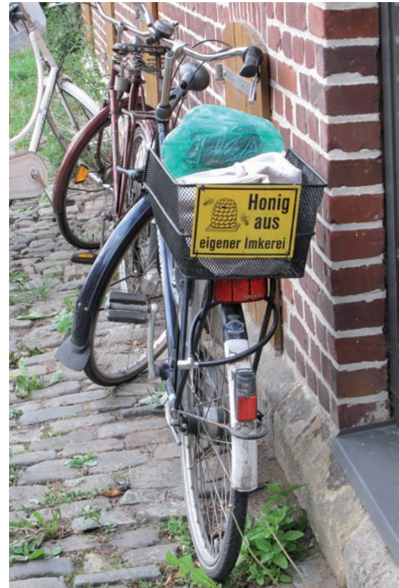
Werbung in der Imkerei kann auch ungewöhnliche Wege gehen. Dieser Fahrradkorb sorgt bestimmt für Aufmerksamkeit.