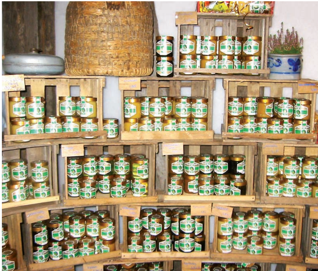
Am Marktstand muss Vielfalt präsentiert werden – auch mit einfachen Hilfsmitteln kann ein ansprechender Stand aufgebaut werden.

Milchsäure nur bei der Jungvolkbildung ein. Kunstschwärme und Jungvölker ohne verdeckelte Brut lassen sich sehr gut mit Milchsäure einsprühen. Viele Imker scheuen die Milchsäurebehandlung im Herbst bzw. Winter. Natürlich muss bei dieser Form der Behandlung ein Tag mit milder Witterung gewählt werden, was