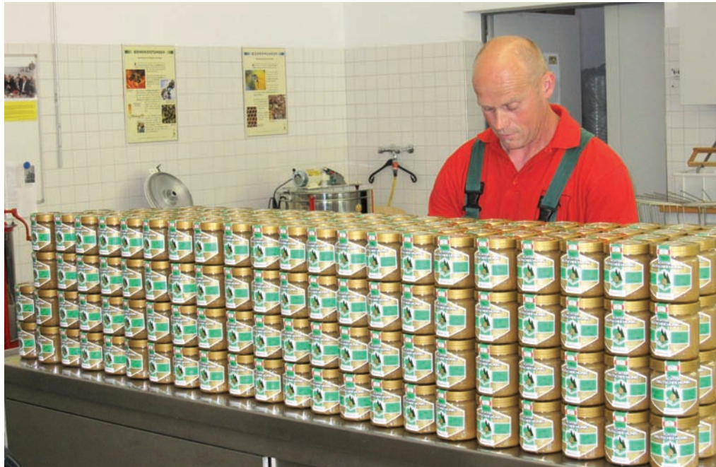
Jetzt erweist es sich als günstig, wenn man genügend Vorräte auf Lager hat.